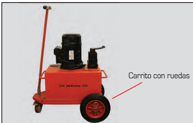
Carrito de ruedas

Todas las bombas se pueden suministrar con estructura de barras redondas, instalada en fábrica. Simplemente añade el sufijo 'P' al número de modelo de la bomba.