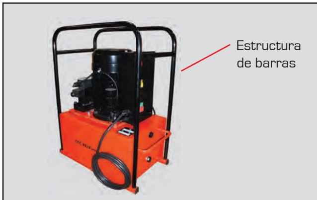
Estructura protectora de barras